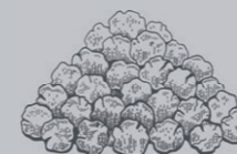
PARADIESKÖRNER GRAINS OF PARADISE