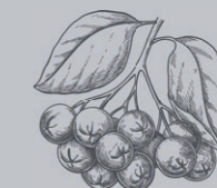
ARONIABEEREN ARONIA BERRIES