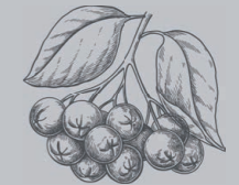
ARONIABEEREN ARONIA BERRIES